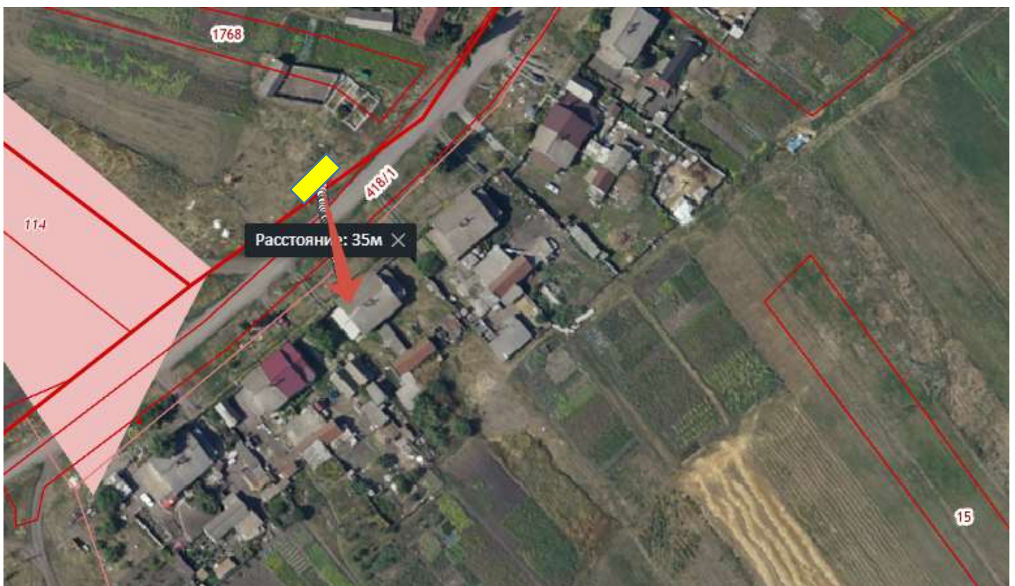
Схема размещения площадки ТКО Воронежская обл., Бутурлиновский р-н, с.Озёрки, ул.им. Сергея Аникина напротив дома № 5 расстояние от контейнера до ближайшего дома 35 м. Координаты N 50,981915 E 40,459385