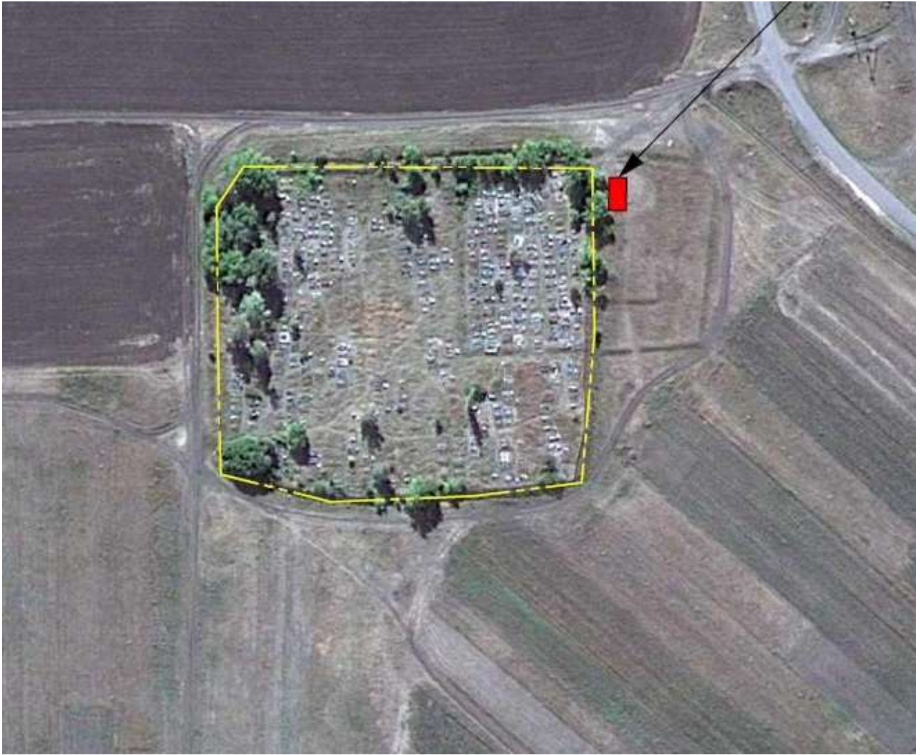
Схема размещения площадки ТКО Воронежская область, Бутулиновский р-он, с.Озёрки южная часть кадастрового квартала 36:05:3000009 Координаты N 50,980966 E 40,474836