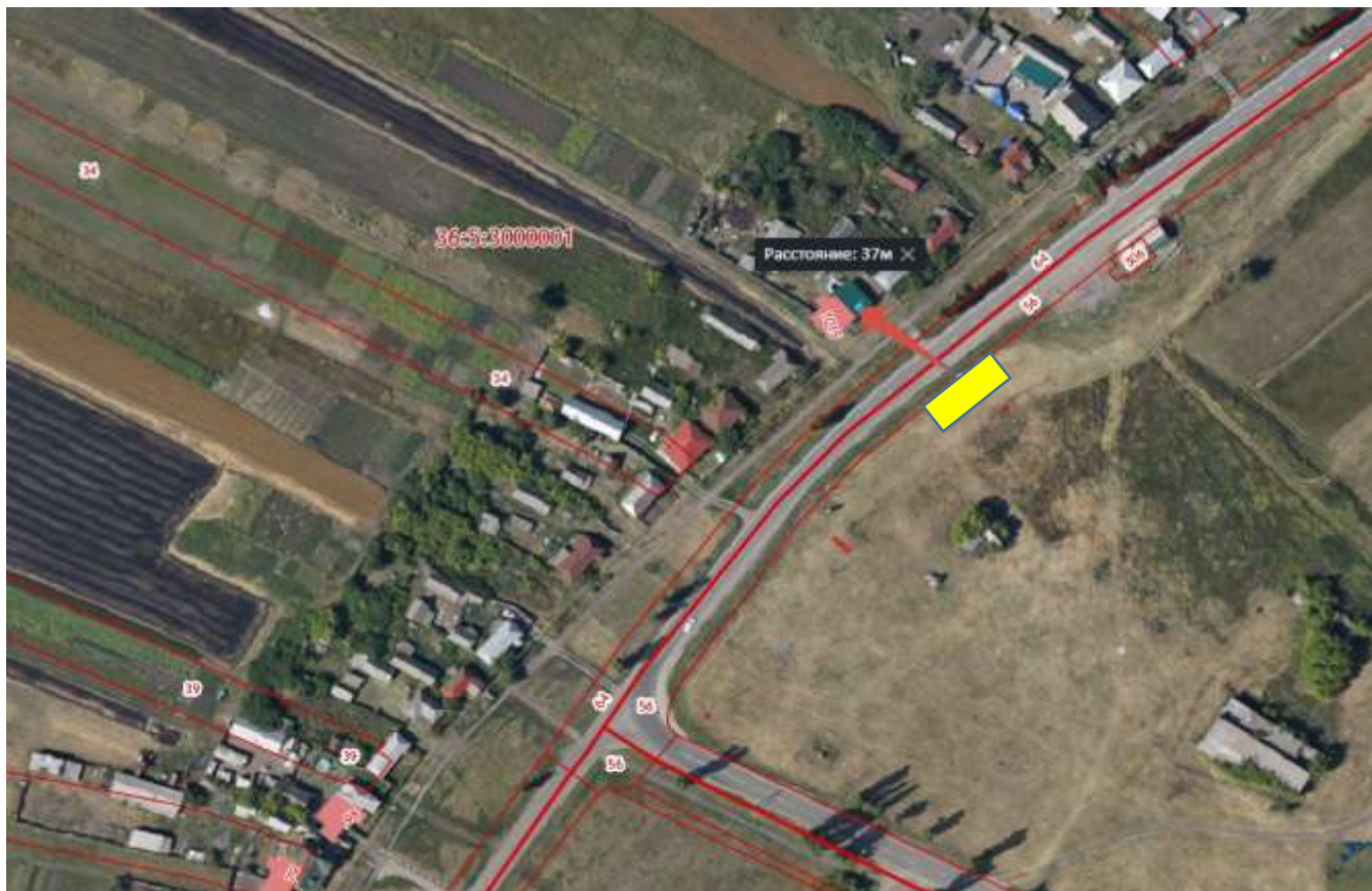
Схема размещения площадки ТКО Воронежская обл., Бутурлиновский р-н, с.Озёрки, ул.им. Сергея Аникина напротив дома № 62 расстояние от контейнера до ближайшего дома 37 м. Координаты N 50,986887 E 40,465364