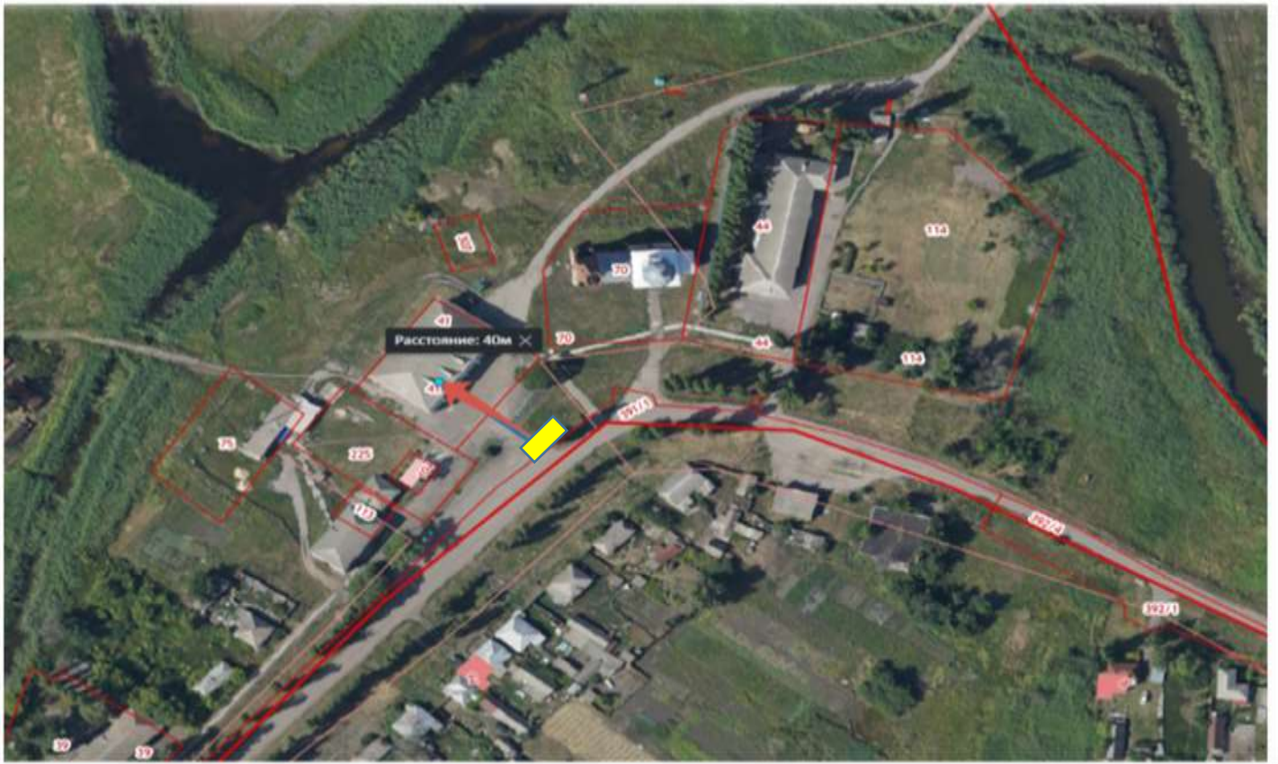
Схема размещения площадки ТКО Воронежская обл., Бутурлиновский р-н, с. Озёрки , ул. Октябрьская напротив дома 15 расстояние от контейнера до ближайшего дома 40 м. Координаты N 50,985748 E 40,475527