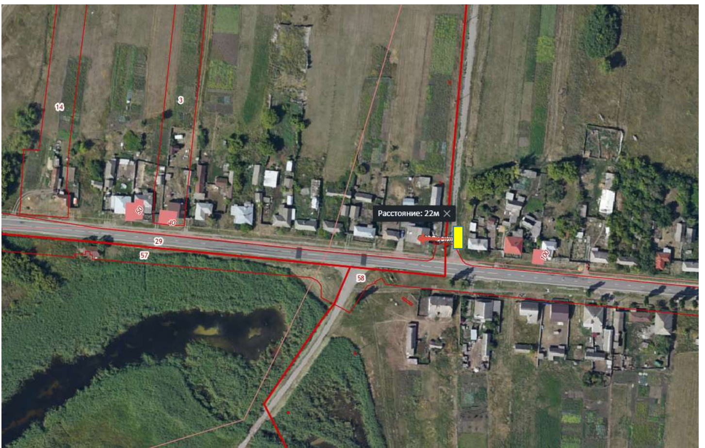
Схема размещения площадки ТКО Воронежская обл., Бутурлиновский р-н, с.Озёрки, ул. Свобода напротив дома № 88 расстояние от контейнера до ближайшего дома 22 м. Координаты N 50,988114 E 40,479216