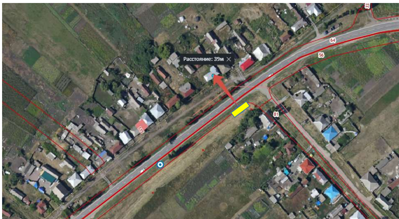
Схема размещения площадки ТКО Воронежская обл., Бутурлиновский р-н, с.Озёрки, ул.им. Сергея Аникина напротив дома № 30 расстояние от контейнера до ближайшего дома 39 м. Координаты N 50,988266 E 40,468218