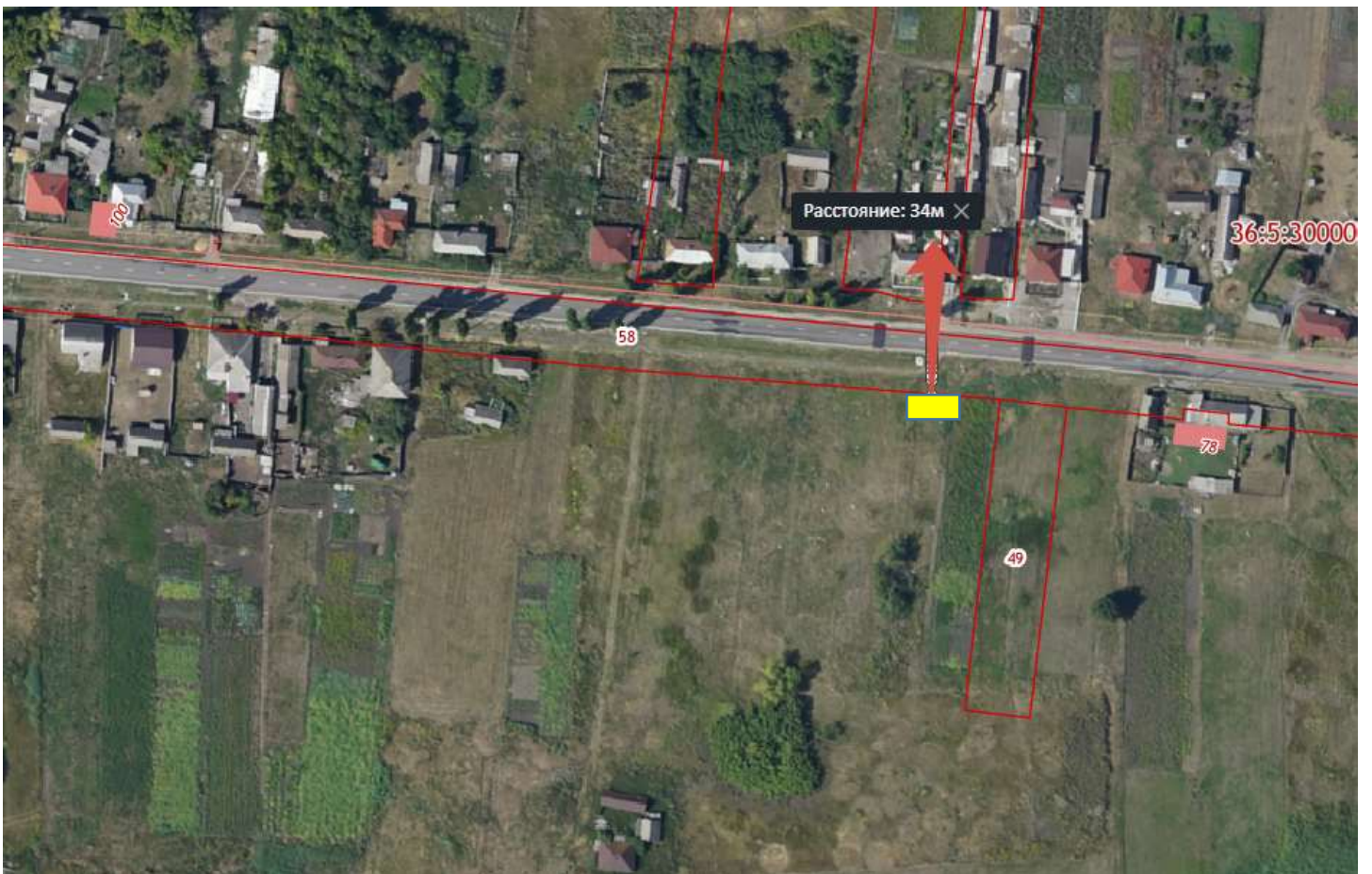
Схема размещения площадки ТКО Воронежская обл., Бутурлиновский р-н, с.Озёрки, ул. Свобода напротив дома № 54 расстояние от контейнера до ближайшего дома 34 м. Координаты N 50,987691 E 40,482814